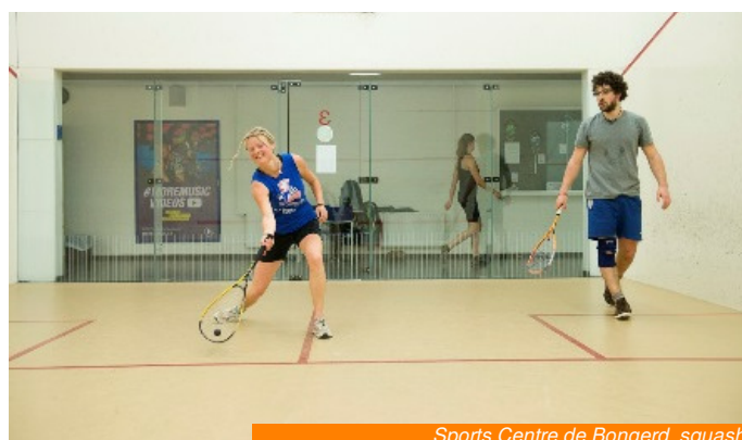
Sports Centre de Bongerd, squash