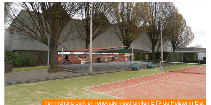
herinrichting park en renovatie kleedruimten ETV de Helster in Elst

Wij vinden respect voor mens en natuur belangrijk. Vanuit die opvatting zoeken wij naar oplossingen voor duurzaamheid en circulariteit. Duurzaamheid is een breed begrip. Iedereen heeft er een ander beeld bij. Wij onderscheiden verschillende onderdelen van duurzaamheid: het gebruik van energie, de juiste keuze van materialen, het herbruikbaar toepassen van materialen en het goed en verantwoord gebruiken van een gebouw door een gezond binnenklimaat te realiseren.