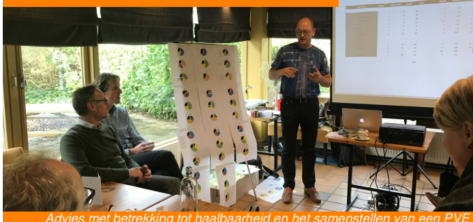
Advies met betrekking tot haalbaarheid en het samenstellen van een PVE