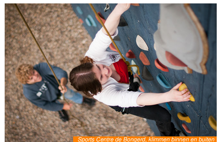
Sports Centre de Bongerd, klimmen binnen en buiten